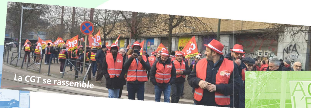
La CGT se rassemble