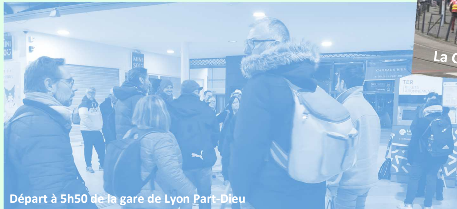
Départ à 5h50 de la gare de Lyon Part-Dieu

À 1h45 du matin, départ de Montluçon pour rejoindre le minibus départemental à Saint-Pourçain-sur-Sioule.