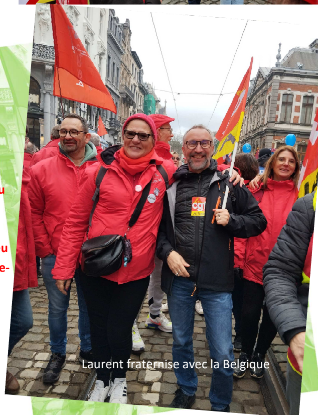
Laurent fraternise avec la Belgique

A la sortie du train, il faut encore rejoindre le lieu de rassemblement.