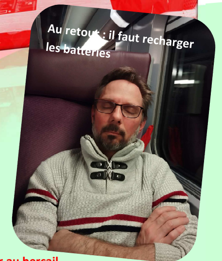
Au retour : il faut recharger les batteries

À l'arrivée de la manif, devant le parlement européen.