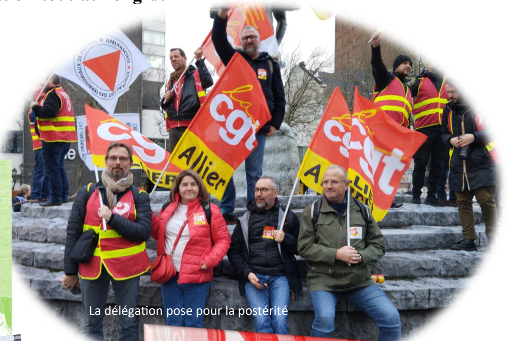
La délégation pose pour la postérité