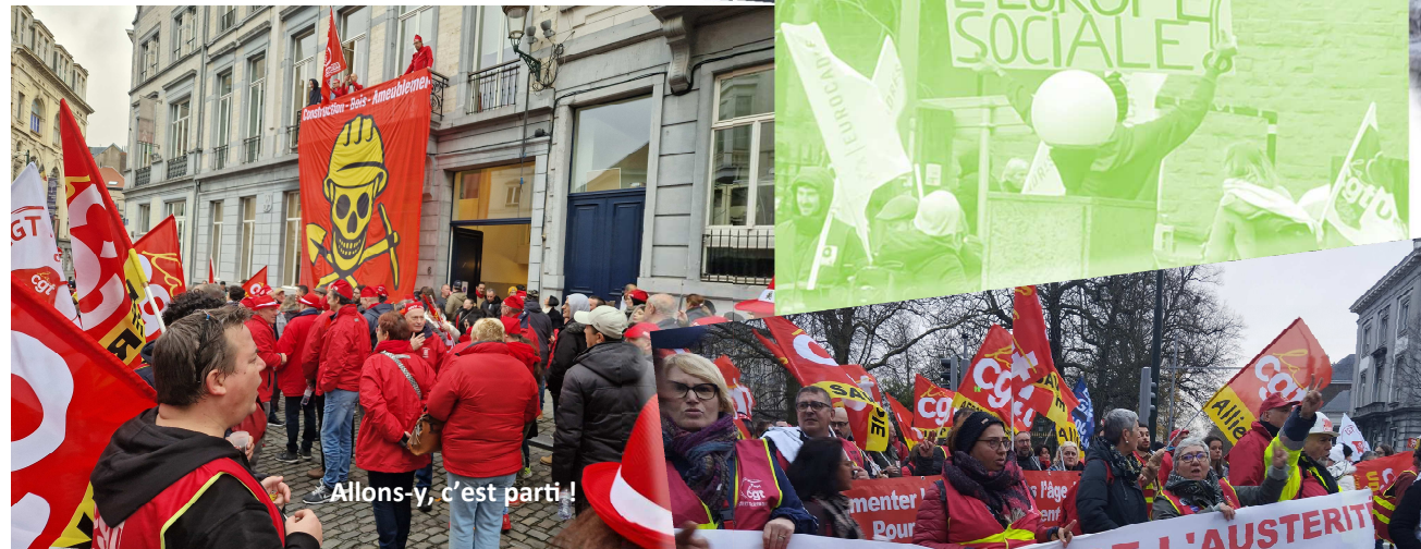
Allons-y, c'est parti!