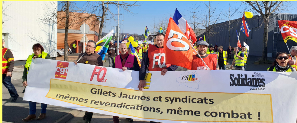
23 février 2019 : acte XV des Gilets jaunes

En 2018, il n'y a pas que le réchauffement climatique qui a fait l'événement, le « climat » social s'est aussi largement détérioré. N'oublions pas les nombreuses étapes d'actions qui ont ponctué le calendrier qui, si elles étaient fréquemment unitaires, se caractérisaient par une CGT à l'initiative et largement présente. La date du 9 octobre annonçait les prémices d'une autre vague de contestations. Le mécontentement s'est revêtu de jaune et s'inscrit, depuis le 17 novembre, dans la durée. Comment faire converger les colères ? C'est un défi auquel s'attèle notre organisation et qui devra trouver des traductions sur les grands axes revendicatifs de 2019.